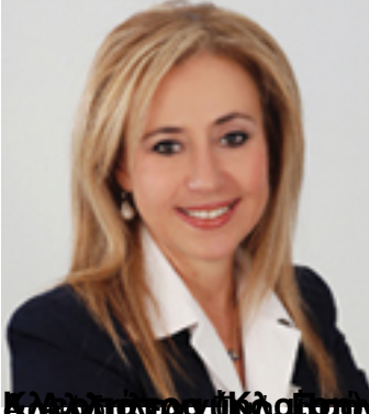
Κοινωνική Επιστήμονας και Δ.Κ.Α.Υ.Δ. Αγ. Τμή, Αρχαία και νεώτερη Παιδεία