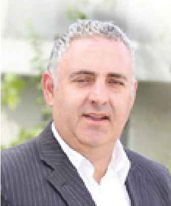
Εκπαιδευτικός, Γενικό Λύκειο Αγ. Τρόφιμου, Κ.Θ.Β.Α. και Πρόεδρος Ηλεκτρονικής Διακυβέρνησης & (ΔΕΠ)