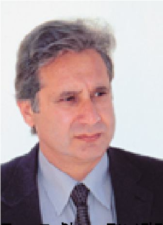
Εκπαιδευτικός, Γενικό Λύκειο Αγ. Τρόφιμου, Κ.Θ.Β.Α. και Πρόεδρος Ανακάλυψης, άνω Λογικού